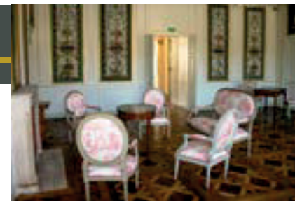
Salon Adrienne. -CG 43-

Le marquis de La Fayette. En arrivant au village de Chavaniac-Lafayette, le visiteur est interpellé par une imposante tour quadrangulaire surplombant le château natal du héros des deux mondes, Gilbert du Motier, plus connu sous le nom de marquis de La Fayette.