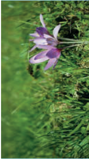
Colchique d'automne. -JM-

Traverser le petit ru sur le pont en pierre.