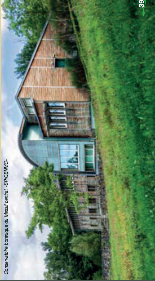
Conservatoire botanique du Massif central. -SP/CBNNM/-

En appui d'une politique de préservation menée en priorité directement sur les espaces remarquables, le Conservatoire botanique dispose également d'une propriété de 5 ha du Conseil général de la Haute-Loire, pour cultiver quelques plants des espèces les plus sensibles du Massif central prélevés du milieu sauvage et préserver ainsi leurs ressources génétiques. En attendant l'accueil du public à travers l'organisation de visites